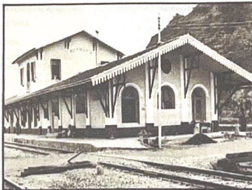
Foto 01 – Vista da primeira estação sem data.